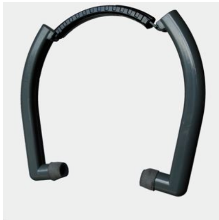
ZEM 26 gehoorbeschermer

STILTE zoeken? Zie voor mogelijke nadelen onderaan in het artikel.